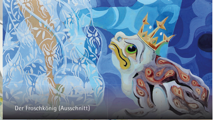
Der Froschkönig (Ausschnitt)