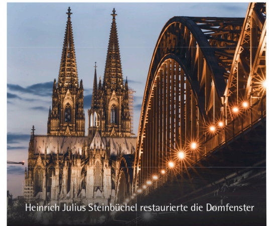
Heinrich Julius Steinbüchel restaurierte die Domfenster

ATELIER STEINBÜCHEL & PARTNER Agentur für Marken- und Vertriebskommunikation