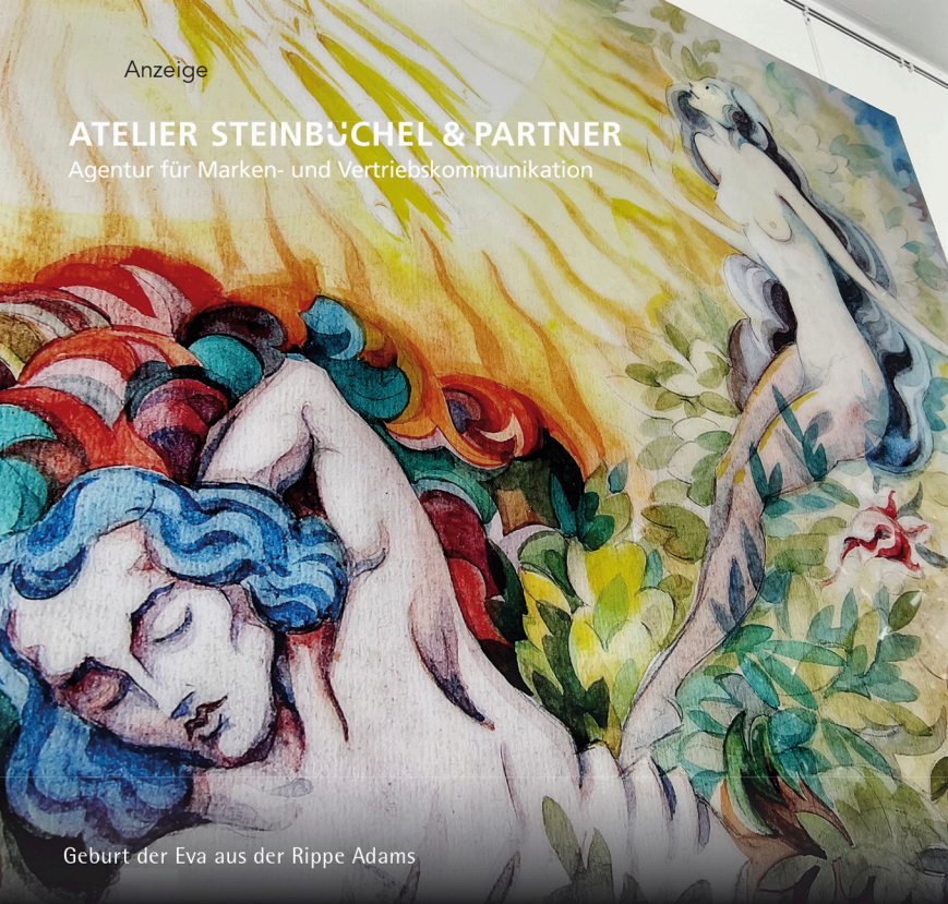
Geburt der Eva aus der Rippe Adams