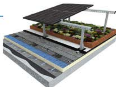
Top-Kombination für das Klima: Gründach und Photovoltaik auf dem Flachdach!